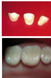
Versorgung mit Keramikonlays nach 10 Jahren. (oben) Veneers sind hauchdünne Schalen aus Keramik